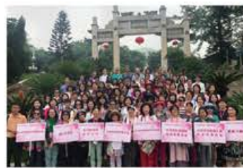
海峽兩岸姐妹同遊廈門