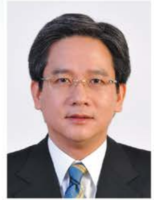
香港婦聯名譽顧問 陳郁傑教授 MH