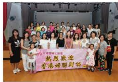
參觀團獲婦女健體班學員熱烈歡迎