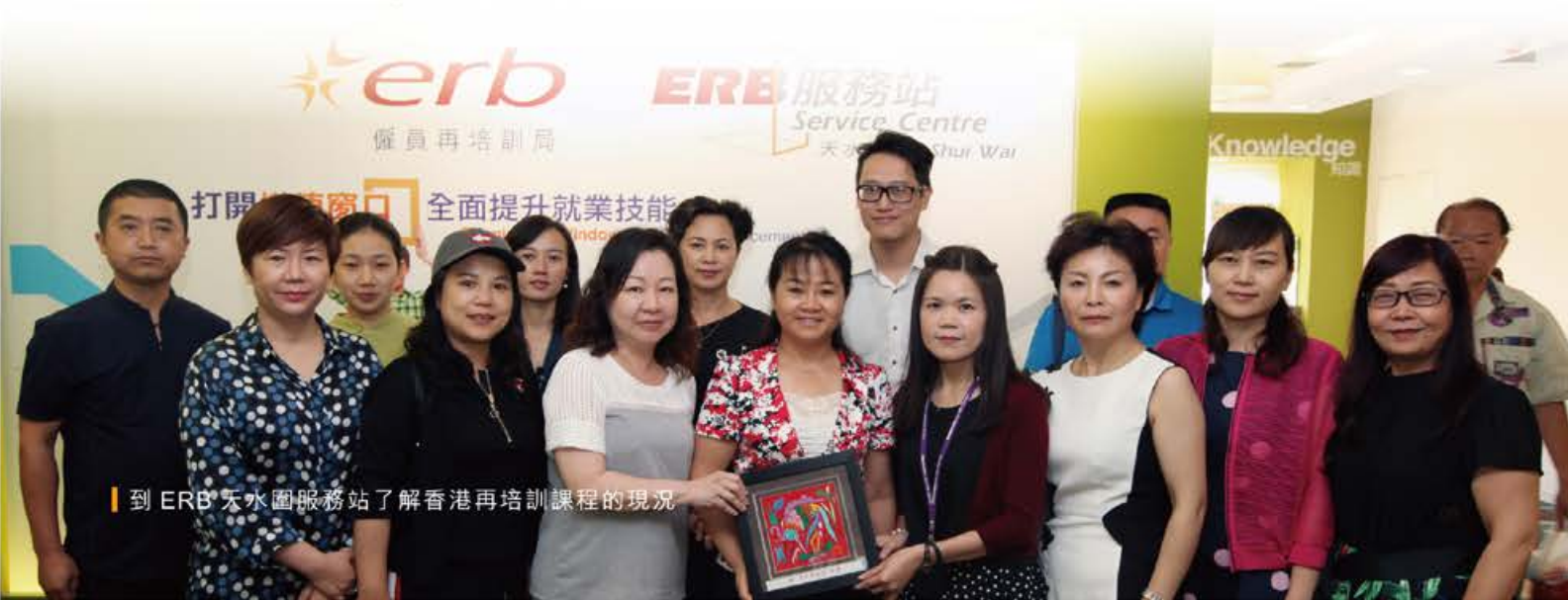
到 ERB 天水圍服務站了解香港再培訓課程的現況