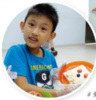
# 愛 # 爸爸