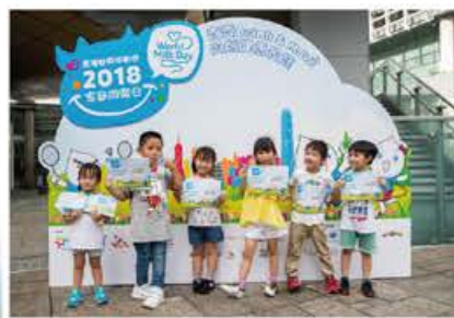
小朋友成為「Drink & Move 大使」，宣揚「每天進食兩份類及運動 60 分鐘」