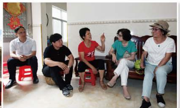
入戶與養蜂創業的婦女進行探訪