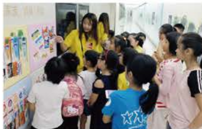
參觀活動提升他們日後投身飲食製造業的興趣