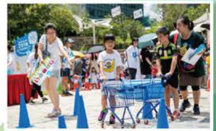
▲ 一家大細投入「Drink & Move」挑戰區