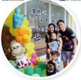
2018 年 8 月 19 日舉行嘉年華暨嘉許禮