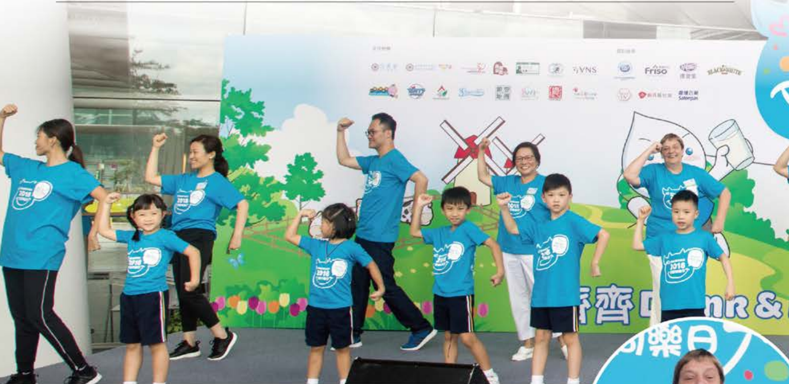
「又跳高 又跳低 定格扭腰擺 姿勢」