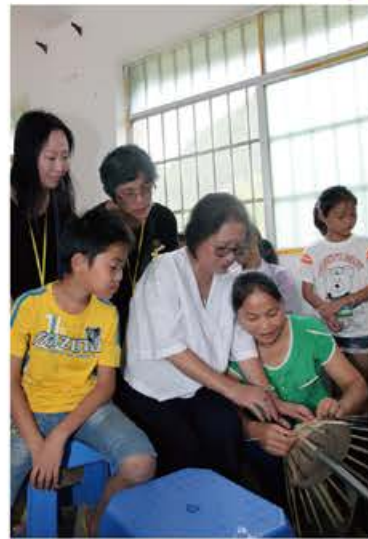
跟巴某村婦女學習紮製竹籃，與她們同行，一起築夢