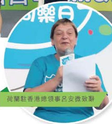
荷蘭駐香港總領事呂安薇致辭