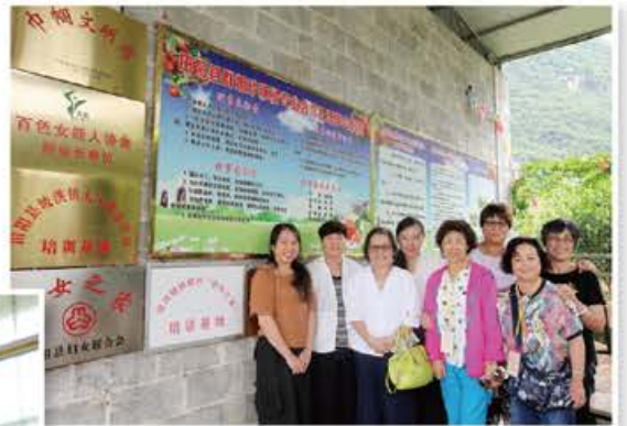
參觀全國巾幗示範基地——群姐砂糖橘基地