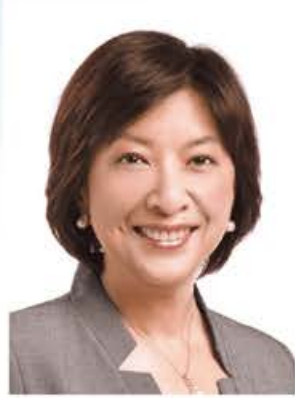
香港婦聯名譽顧問 蔣麗芸議員 SBS, JP