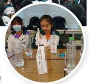
學校教育日 # 源頭減廢