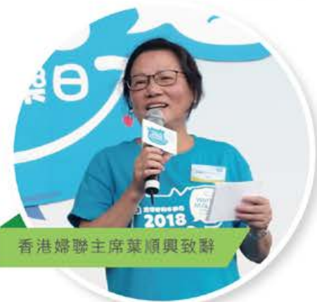
香港婦聯主席葉順興致辭