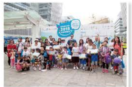
香港婦聯組織超過一千二百人參加活動