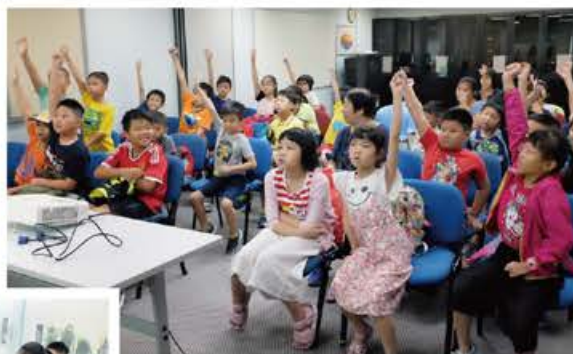
# 上水彩園邨 # 彩玉樓 # 暑期活動

本中心獲「香港賽馬會慈善信託基金」贊助，於 2018 年 7 月 30 日舉行「暑期食品廠半天遊」暑期參觀活動，參與人數約 40 名。小朋友透過參觀食品製造廠的生產線及製作短片，了解食品和飲品的製作過程、分工合作的重要性，以及珍惜食物的價值觀，共把此訊息帶回社區宣揚。