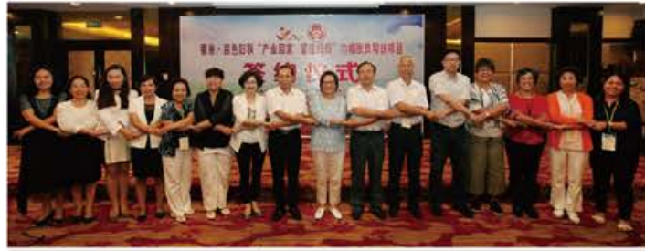
兩地婦聯代表手牽手心連心為脫貧工作貢獻力量