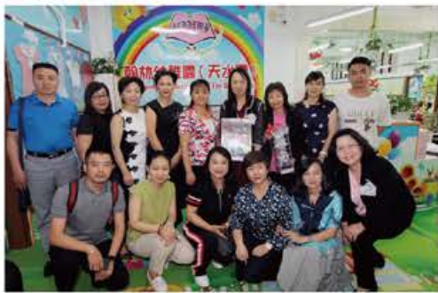
參觀翰林幼稚園（天水圍）