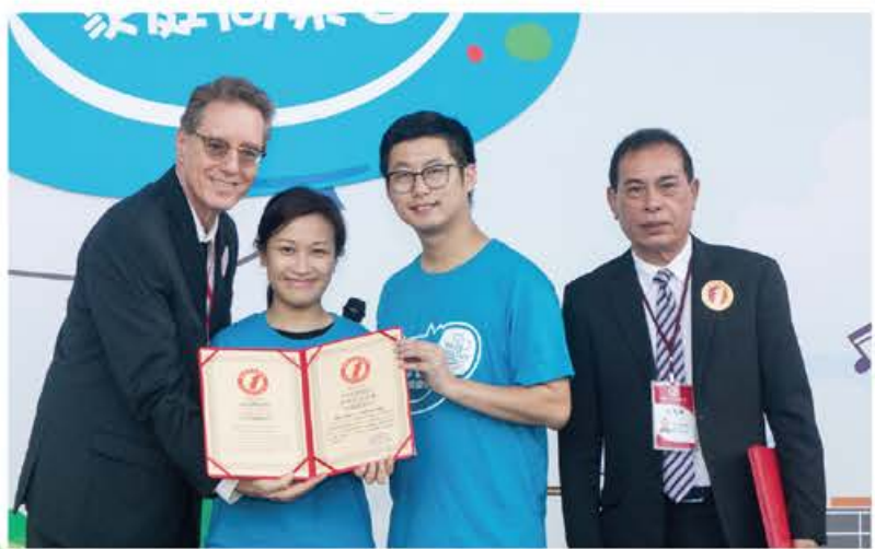
挑戰成功創造「連續六小時最多人次跳世界牛奶日健體操」世界紀錄

活動在香港科學園於2018年6月24日舉行，活動錄得逾2,600人次的入場紀錄，並與1,311位參加者創造「連續六小時最多人次跳世界牛奶日健體操」世界紀錄。