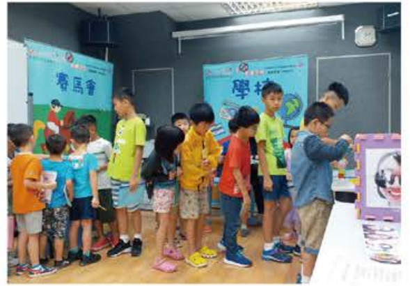
# 大埔大元邨 # 泰德樓 # 不賭有理

2018年8月，在本中心舉行「模擬人生遊戲」活動，透過同工及義工帶領遊戲及小組分享，藉此明白賭博借貸所出現的嚴重性，繼而辨識人生價值觀，強化個人社會功能。