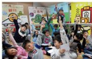
小朋友踴躍回答問題 # 模擬人生遊戲