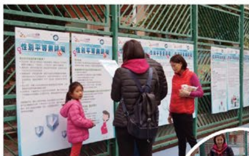
# 天水圍天晴邨 # 性別平等 # 平等機會委員會競技

1 月舉行由平等機會委員會贊助「性別平等無障礙」遊戲競技日，透過活動讓天水圍區的年輕家庭可以有一天的親子活動日，在遊戲中除了讓家庭認識「性別歧視條例」的原則、日常及社區應用外，家長們還需要鼓勵子女一同完成懷舊的競技遊戲及與子女建立互相溝通、支持的橋樑。