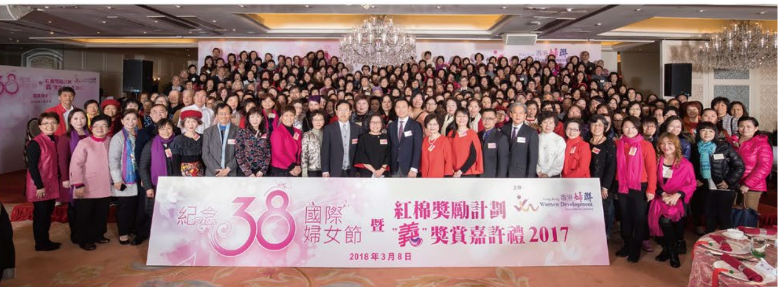
主禮嘉賓、嘉賓與一眾得獎者大合照