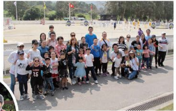
# 上水彩園邨 # 彩玉樓 # 馬術比賽