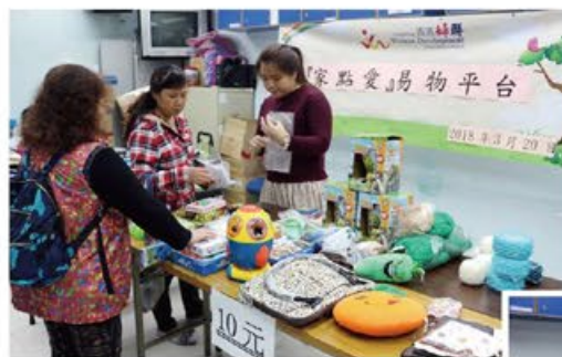
社區人士在選購心儀物品 # 環保 # 易物