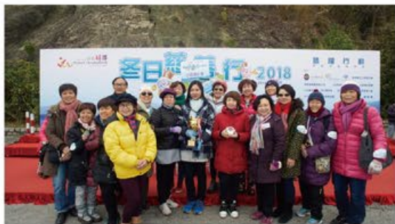
立法會議員梁志祥(左四)頒發團體級別金獎予沙田婦女會代表