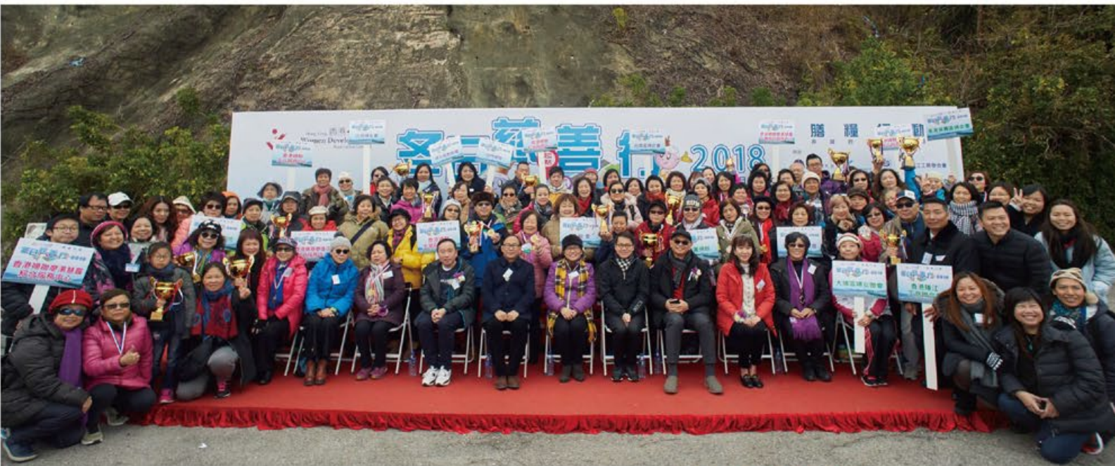
主禮嘉賓、本會正副主席與團體級別得獎者合照