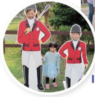
大小朋友扮騎師 # 騎師 # 親子活動