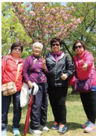
老友記都對日本賞花感到興奮 # 櫻花