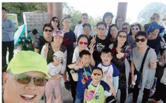
# 天水圍天華邨 # 旅行 # 會員

4 月舉辦會員旅行活動「百花春城—越南河內、下龍灣、海防」，鼓勵會員按個人嗜好、興趣去選擇參與本會的深度遊，除增廣見聞、認識新事物外，亦能舒緩情緒，有助減壓。