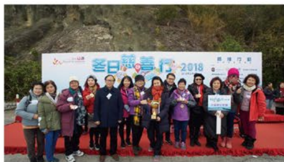
立法會議員梁志祥(左五)頒發團體級別金獎予北區婦女聯會代表