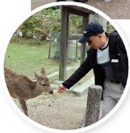
餵鹿可說是老友最期待之行程 # 奈良餵鹿