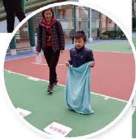
親子活動日 # 競技