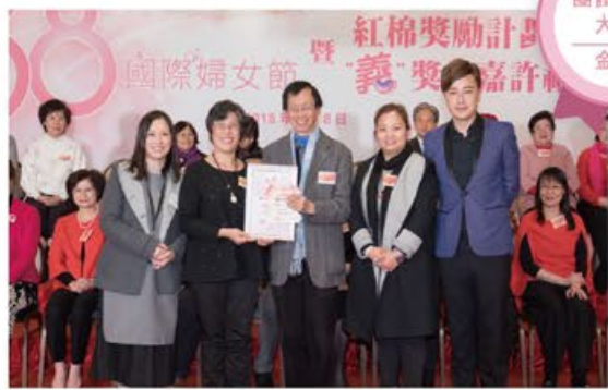
團體參與 大獎 金獎