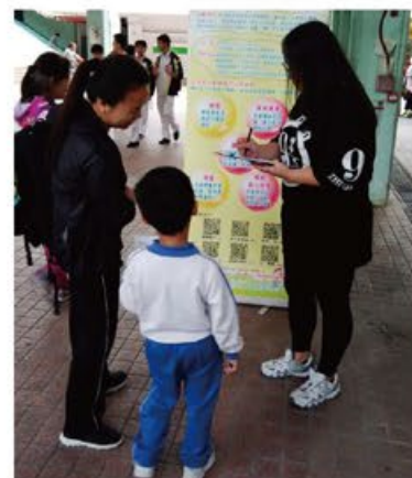
負責計劃同工向區內人士進行問卷調查 # 問卷調查