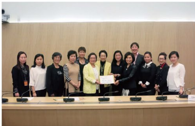
香港婦聯代表遞交意見書予婦女事務委員會代表